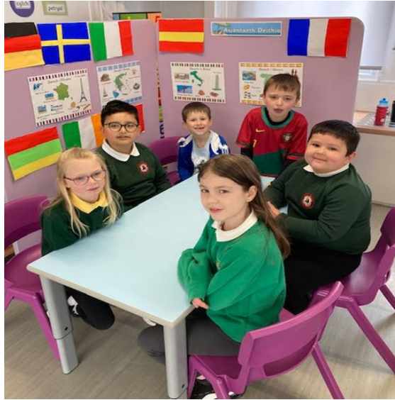
Canolfan Gwenllian Amrywiol / Various

Diwedd hanner tymor prysyr arall ac rydyn ni wedi bod yn dysgu am yr ardal leol, gwledydd Ewrop ac anifeiliaid. Rydyn ni wedi cael llawer o hwyl yn bwcio ein gwyliau delfrydol ac wedi mwynhau diwrnod heulog hyfryd ar y traeth yn Ynys y Barri. Nawr mae hi'n amser i ffarwelio â charfan arall o ddisgyblion! Pob hwyl a phob lwc hanner tymor nesaf yn parhau i ddatblygu eich sgiliau Cymraeg.