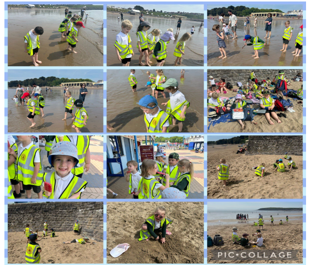
Dosbarth Dwynwen Derbyn/1/2 / Reception/1/2

We have really enjoyed learning all about the animals in Australia, the beaches in Portugal and French culture this half term. We spoke to Miss Pugh's friend in Australia over zoom, and made an ocean in a bottle on the yard. We went on a lovely trip to Barry Island where the weather was beautiful and we went into the sea and ate ice cream. On the last day of term, we tasted some French food - yum!