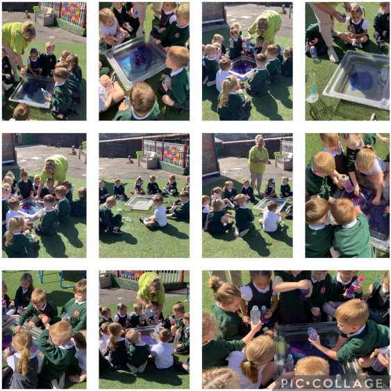
Dosbarth Branwen Meithrin / Nursery

Rydyn ni wedi mwynhau dysgu am anifeiliaid Awstralia, traethau Portiwgal a diwylliant Ffrainc yn ystod yr hanner tymor yma. Gwnaethon ni siarad â ffrind Miss Pugh yn Awstralia dros zoom, a chreu môr mewn potel ar yr iard. Aethon ni ar drip hyfryd i Ynys Y Bari lle roedd y tywydd yn braf iawn ac aethon ni mewn i'r môr a bwyta hufen iâ. Ar ein diwrnod olaf, blason ni fwyd Ffrengig - mmm!